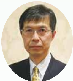
新潟大学大学院 歯科麻酔学分野