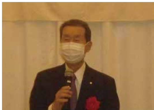
本部同窓会 生駒等会長